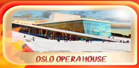
OSLO OPERA HOUSE