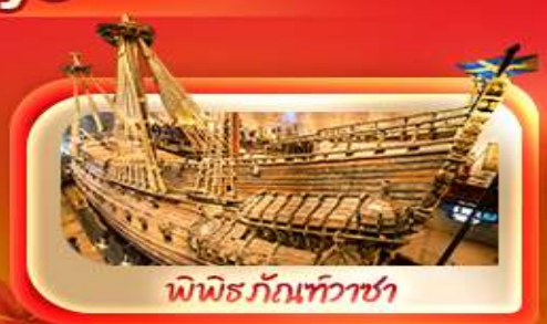
พิพิธภัณฑ์ท้าวชา