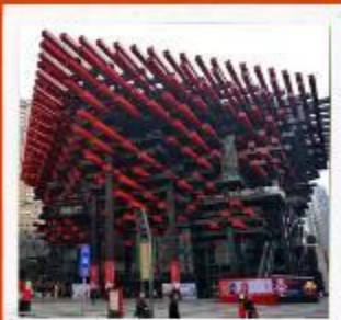
พิพิธภัณฑ์ศิลปะฉงชิ่ง