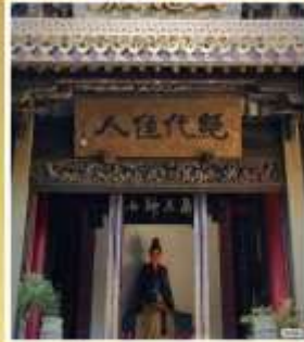
บ้านเกิด 4 ยอด หญิงงามไซซี