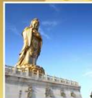
องค์เจ้าแม่กวนอิมหนานไห่