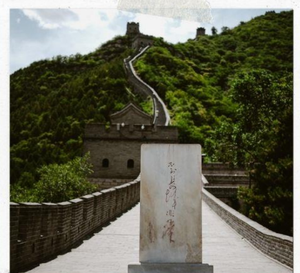
กำแพงเมืองจีน ด่านฉวิหยงกวน