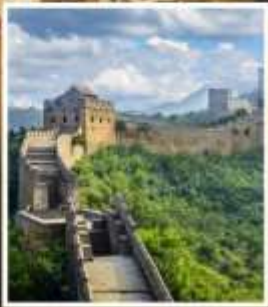
กำแพงเมืองจีน จีหยงกวน