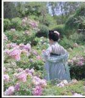
เทศกาลดอกโบตั๋น