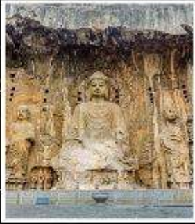
พระพุทธรูปแกะสลัก หิมหลงเหมิน