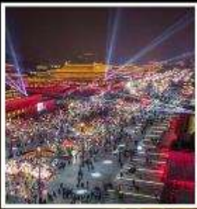
ถนนคนเดินวัฒนธรรมต้าถิง