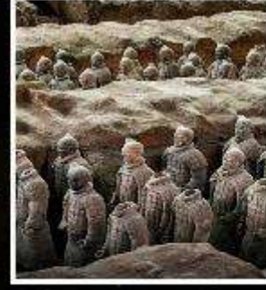
พิพิธภัณฑสถานแห่งชาติ ทหารม้าจีนซี