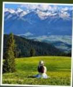
ทุ่งหญ้านาลาจัน