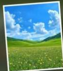
ทุ่งหญ้าแห่งท้องฟ้า