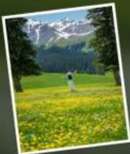
ทุ่งหญ้านาราตี

รับฟรี!! ประกันสุขภาพ และ อุบัติเหตุ 2 ล้านบาท