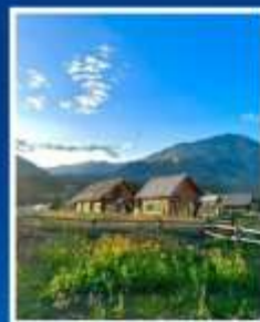
หมู่บ้านเหม่อลุ่ม