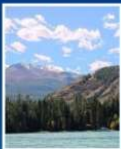
ล่องเรือ ทะเลสาบคานาสี