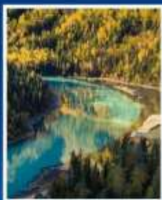
ทะเลสาบมังกรหลับ