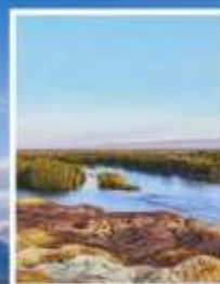
ธารน้ำ 5 สี