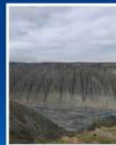
แกรนด์แคนยอน ตุซันจิว