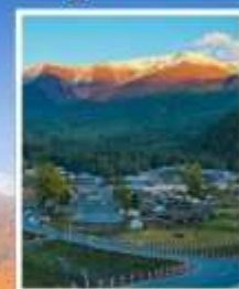
หมู่บ้านโปฮาลา