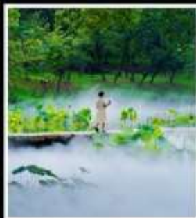
สวนสาธารณะหยวนไท่จู่