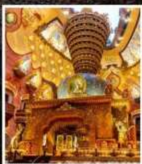
ภูเขาหินฉัวซาน