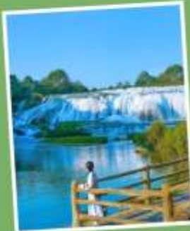
น้ำตกโต้วพั๋วถาง