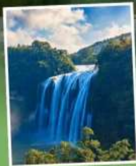
น้ำตกหวงกั๋วชู่