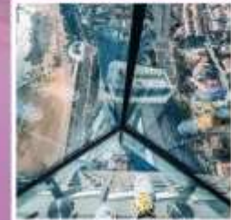
QINGDAO HAITIAN CENTER