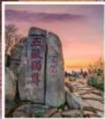
หินแกะสลักในสมัย ราชวงศ์ถัง