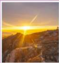
ยอดเขาอวิ๋ฮวาง