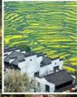
หมู่บ้านโบราณหวงหลิ่ง