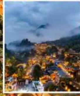
หมู่บ้านเกอต้าวังเซียนกู่