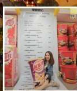
SNACK BUSY STATION