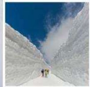
กำแพงหิมะ เจแปนแอลป์