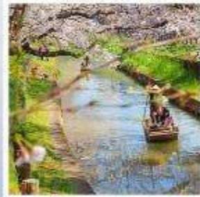
ศาลเจ้าอิคาวะ