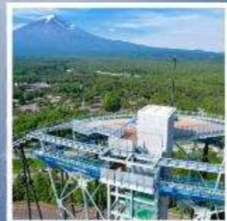
ฟูจิยามะ ทาวเวอร์

ศาลเจ้าอิคาวะ คลองแห่งดอกซากุระที่ห้ามพลาด โตเกียวดิสนีย์แลนด์ ดินแดนใบฝืนของคนทั้งโลก เปิดประสบการณ์อัศจรรย์กำแพงหิมะ บนเทือกเขาเจแปนแอลป์ SPRING QUARTET สวนดอกไม้หลากสีกับทัศนียภาพแสนสวย SHIRAKAWAGO หมู่บ้านโบราณ มรดกโลก ที่มีชื่อเสียงมากที่สุดในญี่ปุ่น ชมฟูจิ 2 บรรยากาศ ส่องเรืออัปปะระะและขึ้นจุดชมวิวฟูจิยามะ ทาวเวอร์ พักย่านใจกลางเมืองโตเกียว 2 คืน!!! // พักออนเซ็น 1 คืน!!! อาหารพิเศษ...บุฟเฟ่ต์ปิ้งย่าง, บุฟเฟ่ต์ชาบู กรุ๊ปสบายๆ เพียง 20 ท่านเท่านั้น!!!