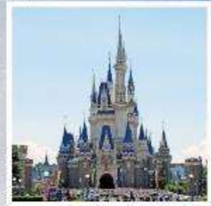
โตเกียว ดิสนีย์แลนด์