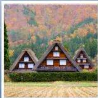
หมู่บ้านมรดกโลก ชิราคาวาโกะ