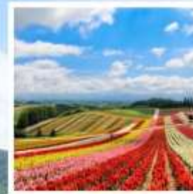
สวนดอกไม้ชิชิโนะโอกะ