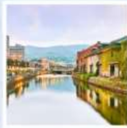
เมืองโอตารุ