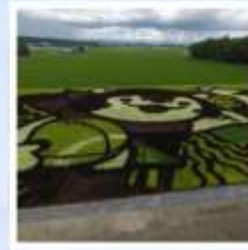
ศิลปะบนนาข้าว