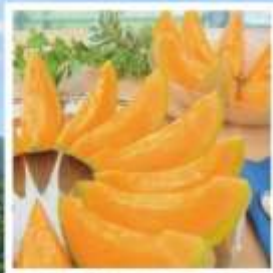
ศูนย์จำหน่ายเมล่อนยูบาริ