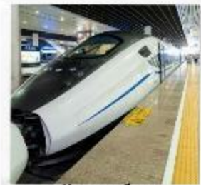
รถไฟความเร็วสูง สู่จิวจ้ายโกว