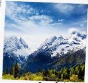
ภูเขาหิมะการ์เซีย ตำกู่ปิงชวง