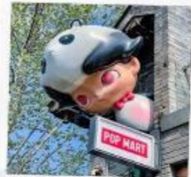
ชอยกวางแดบ