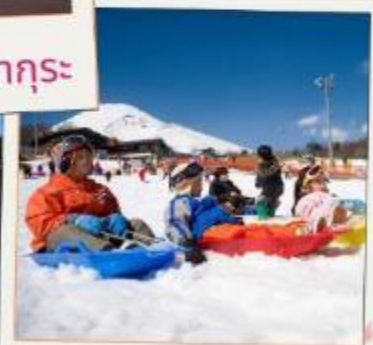
ลานสกีเยติ