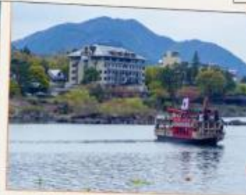
ล่องเรืออาปาเระ