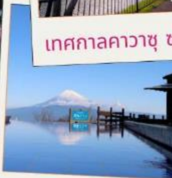
อิซุ พาโน라마 พาร์ค