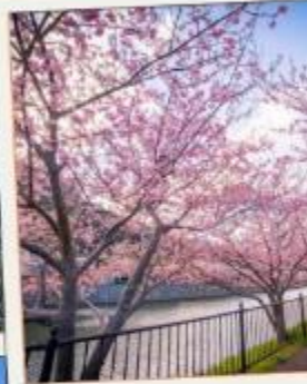
เทศกาลคาวาซุ ซากุระ