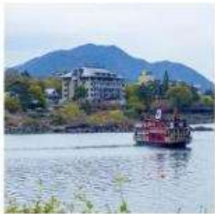
ล่องเรืออปปะระ