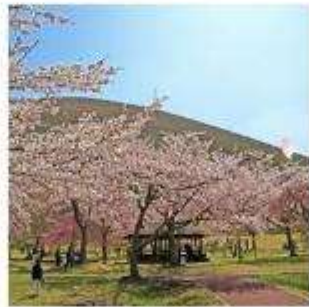
ซากุระ โนะ ซาโตะ