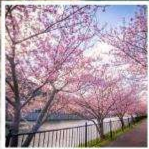
เทศกาลคาวาซุ ซากุระ