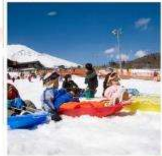
ลานสกีเยติ