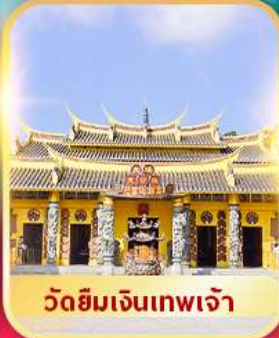
วัดยิมเงินเทพเจ้า