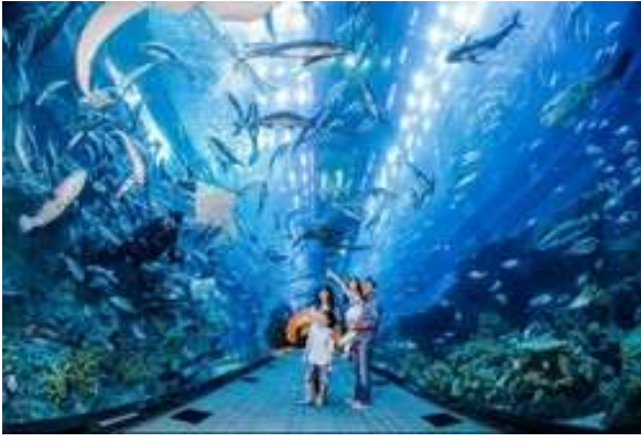
ของทะเลต่างๆ ทั่วโลก

*** Sea. Aquarium(ยังไม่รวมค่าบัตร)(ไปสดแจ้งและชำระค่าบัตรก่อนเดินทาง ได้ในราคา ผู้ใหญ่ 1,350 บาท / เด็ก อายุต่ำกว่า 12ปี ราคา 1,190 บาท) S.E.A. Aquarium เป็นพิพิธภัณฑ์สัตว์น้ำเปิดใหม่ใหญ่ที่สุดในโลกกับ Marine Life Park จัดอันดับให้เป็นอควาเรียมใหญ่ที่สุดในเอเชีย ตะวันออกเฉียงใต้ ถูกออกแบบให้เป็นอุโมงค์ใต้น้ำ สามารถบรรจุน้ำเค็มได้กว่า 45 ล้านลิตร รวมสัตว์ทะเลกว่า 800 สายพันธุ์ รวบรวมสัตว์น้ำกว่า 100,000 ตัว ตกแต่งด้วยฉากประติมากรรมของเรือ ภายในได้จำลองความอุดมสมบูรณ์