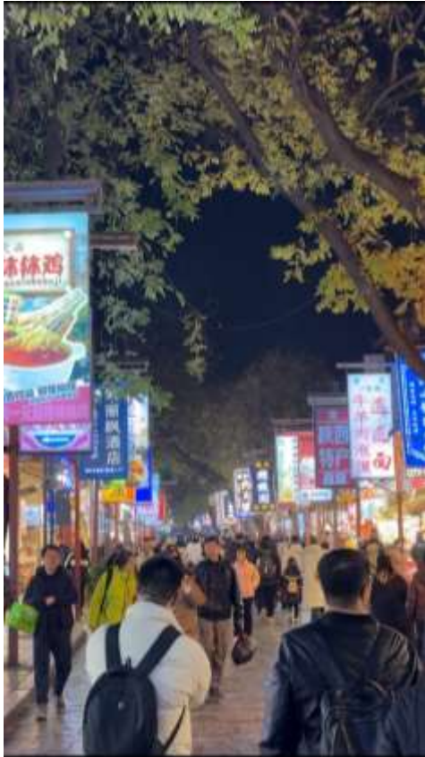
นำทุกท่านไป ถนนมุสลิม ( Muslim Quarter ) (ระยะทางประมาณ 500

เมตร ใช้เวลาเดินเท้าประมาณ 5 นาที) ย่านการค้าที่เต็มไปด้วยร้านอาหารและร้านค้าของชาวมุสลิม เป็นสถานที่ที่นักท่องเที่ยวสามารถสัมผัสวัฒนธรรมและชิมอาหารพื้นเมืองได้