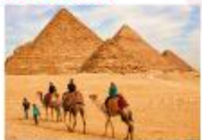
พีรามิดขั้นบันได