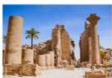
มหาวิหารคาร์นัค

xx.xx น. ออกเดินทางสู่เมืองลักซอร์ เที่ยวบิน... xx.xx น. เดินทางถึงสนามบินลักซอร์