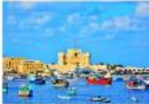
เมืองอเล็กซานเดรีย

** พักที่ Mamlouk Pyramids Hotel 4* หรือเทียบเท่า **