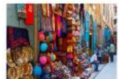
ตลาดขานเอลคาลลี

20.50 น. ออกเดินทางสู่อิสตันบูล เที่ยวบิน TK695