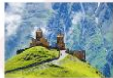
Gergeti sameba church

** พักที่ Intourist Kazbegi Hotel หรือเทียบเท่า **