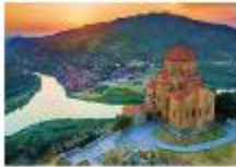
อารามจวารี