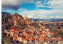
เมืองทบิลีซี

05.20 น. เดินทางถึงสนามบินอิสตันบูล แวะเปลี่ยนเครื่อง 06.55 น. ออกเดินทางสู่สนามบินทบิลีซี เที่ยวบิน TK378 09.45 น. เดินทางถึงสนามบินทบิลีซี ประเทศจอร์เจีย