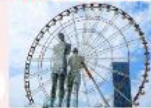
รูปปั้นอาลีและนีโน