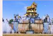
เมืองคูโทซี

** พักที่ Kutaisi Inn Hotel หรือเทียบเท่า **