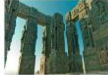
CHRONICLE OF GEORGIA

** พักที่ Clock Town Hotel หรือเทียบเท่า **