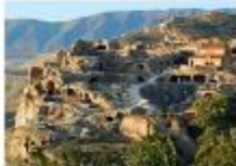
เมืองอุพลิสซิเค