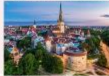
Tallinn Old Town