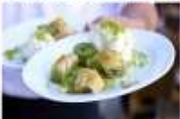
ชิมไอศกรีมตุรกีต้นกำเนิด Nemrut Mountain