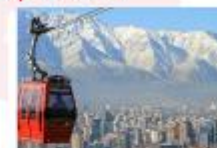
นั่งกระเช้าขึ้นสู่เนินเขาซานต้า ลูเซีย