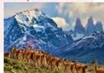
อุทยานแห่งชาติตอร์เรส เดล เพน