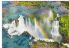
อุทยานแห่งชาติอิกวาซู

xx.xx น. ออกเดินทางสู่อุทยานแห่งชาติอิกวาซู เที่ยวบิน... xx.xx น. เดินทางถึงอุทยานแห่งชาติอิกวาซู