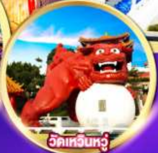
วัดเหวินหู่