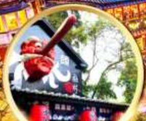
หมู่บ้านปิสางชิวโก