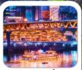
"ล่องเรือชมฉงชิ่ง"