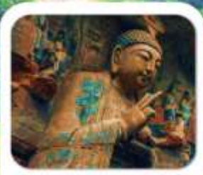
"มรดกโลกผาหินแกะสลักต้าจู้"