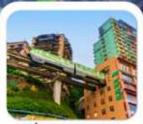
"นั่งรถไฟทะเลสาบ"