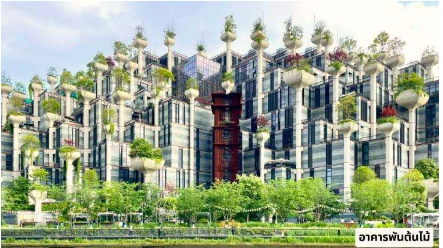
อาคารพันต้นไม้

จากนั้นนำทุกท่านเยี่ยมชม "อาคารพันต้นไม้" สวนลอยบาปไคเนซึกใหม่กกลางเซี่ยงไฮ้ กลุ่มอาคารพาณิชย์ที่ประดับตกแต่งด้วยต้นไม้มากกว่า 1,000 ต้น ในตัวเมืองเทศบาลนครเซี่ยงไฮ้ ทางตะวันออกของจีน ได้เปิดให้ประชาชนทั่วไปเข้าเยี่ยมชม อาคารดังกล่าวมีชื่อว่า "เทียนอันเซียนซู่" (Tian An 1,000 Trees) ออกแบบโดยสถาปนิกชาวอังกฤษ โทมัส เฮเธอร์วิก ผู้อยู่เบื้องหลังการออกแบบพาววิลเลียนของสหราชอาณาจักร ในงาน Shanghai World Expo ปี 2010 และอาคารพันต้นไม้ในครั้งนี้ ได้แรงบันดาลใจมาจาก "เซาหวงซาน" มรดกโลกที่ยิ่งใหญ่ของจีน ในมณฑลอันฮุย