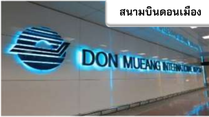
สนามบินดอนเมือง

เวลา 22.30 น. พร้อมกันที่ ท่าอากาศยานดอนเมือง อาคารผู้โดยสารขาออกระหว่างประเทศ เคาน์เตอร์สายการบินไทยแอร์เอเชีย เจ้าหน้าที่คอยให้การต้อนรับดูแลด้านเอกสาร เช็คอิน และสัมภาระในการเดินทาง