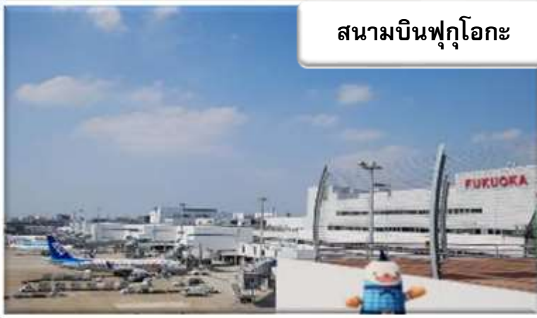
สนามบินฟุกุโอกะ

เวลา 01.45 น. ออกเดินทางสู่ สนามบินฟุกุโอกะ ประเทศญี่ปุ่น โดยสายการบินไทยแอร์เอเชีย เที่ยวบินที่ FD 236