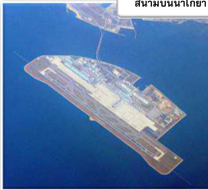
สนามบินนาโกย่า