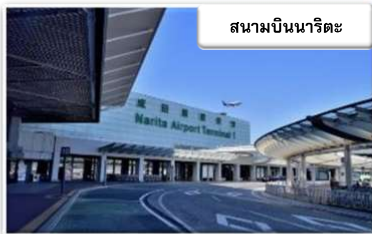
สนามบินนาริตะ

เวลา 06.20 น. เดินทางถึง สนามบินนาริตะ ประเทศญี่ปุ่น นำท่านผ่านขั้นตอนการตรวจคนเข้าเมืองและศุลกากร