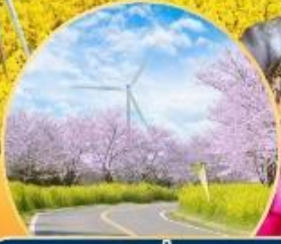
จากุระ / พุ่มดอกเรป