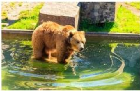
บ่อหมีสีน้ำตาล

เมืองหลวงของประเทศสวิตเซอร์แลนด์ เมืองโบราณเก่าแก่สร้างขึ้นเมื่อ 800 ปีที่แล้ว โดยมีแม่น้ำอาเร่ (Aare) ล้อมรอบตัวเมือง เสมือนเป็นป้อมปราการทางธรรมชาติไว้ 3 ด้าน นำท่านเที่ยวชมสถานที่สำคัญต่างๆในกรุงเบิร์น กรุงเบิร์นได้รับการยกย่องจากองค์การยูเนสโกให้เป็นเมืองมรดกโลก ในปี ค.ศ. 1863 นอกจากนี้เบิร์นยังถูกจัดอันดับอยู่ใน 1 ใน 10 ของเมืองที่มีคุณภาพชีวิตที่ดีที่สุดในโลก ในปี ค.ศ. 2010