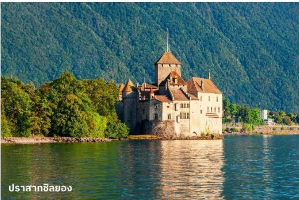
ปราสาทซิลยอง