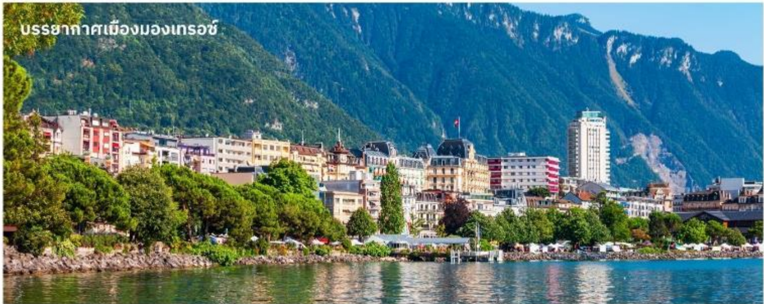
บรรยากาศเมืองมงเทรอร์ช

จากนั้นนำท่านเดินทางสู่ เมืองแทสช์ (Tasch) ด้วยรถไฟ และเดินทางด้วยรถบัสต่อไปยัง เมืองมงเทรอร์ช (Montreux) ใช้เวลาเดินทางประมาณ 2 ชั่วโมง เมืองตากอากาศที่ตั้งอยู่ริมทะเลสาบเจนีวา ได้ชื่อว่าเป็นริเวียร่าของสวิส ชมความสวยงามของทิวทัศน์ บ้านเรือน ริมทะเลสาบ นำท่านถ่ายรูปด้านหน้า ปราสาทซิลยอง (Chillon castle) ปราสาทโบราณอายุกว่า 800 ปี สร้างขึ้นบนเกาะหินริมทะเลสาบเจนีวา ตั้งแต่ยุคโรมันเรื่องอำนาจโดยราชวงศ์ SAVOY โดยมีจุดมุ่งหมายเพื่อควบคุมการเดินทางของนักเดินทางและขบวนสินค้าที่จะสัญจรผ่านไปมาจากเหนือสู่ใต้หรือจากตะวันตกสู่ตะวันออกของสวิตเซอร์แลนด์ เนื่องจากเป็นเส้นทางเดียวที่ไม่ต้องเดินทางข้ามเทือกเขาสูงชัน ปราสาทแห่งนี้จึงเปรียบเสมือนด่านเก็บภาษีซึ่งเอาเปรียบชาวสวิสมานานนับร้อยปี