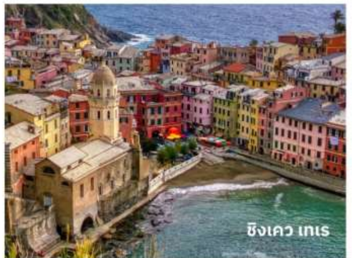
ซิงเคว เทเร

ท่านสามารถทำการสแกน QR CODE นี้ เพื่อรับชม “ซิงเควเทเร” ในรูปแบบวิดีโอ