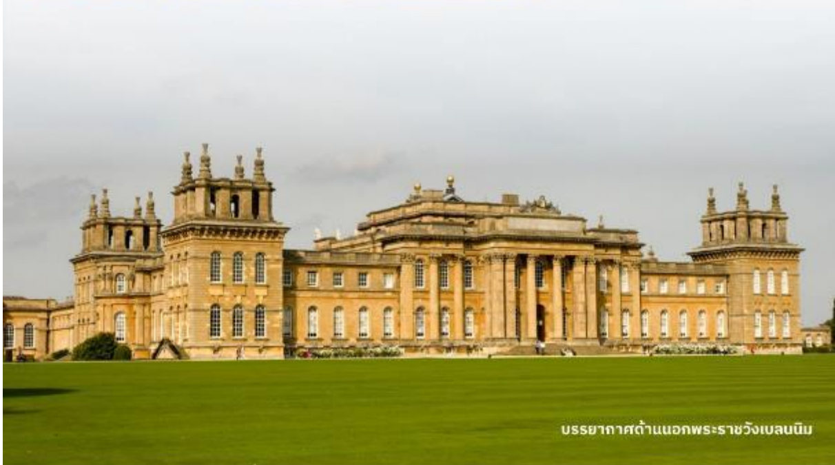
บรรยากาศด้านนอกพระราชวังเบลนนิม

DoubleTree by Hilton Hotel Londo -Docklands Riverside หรือเทียบเท่า