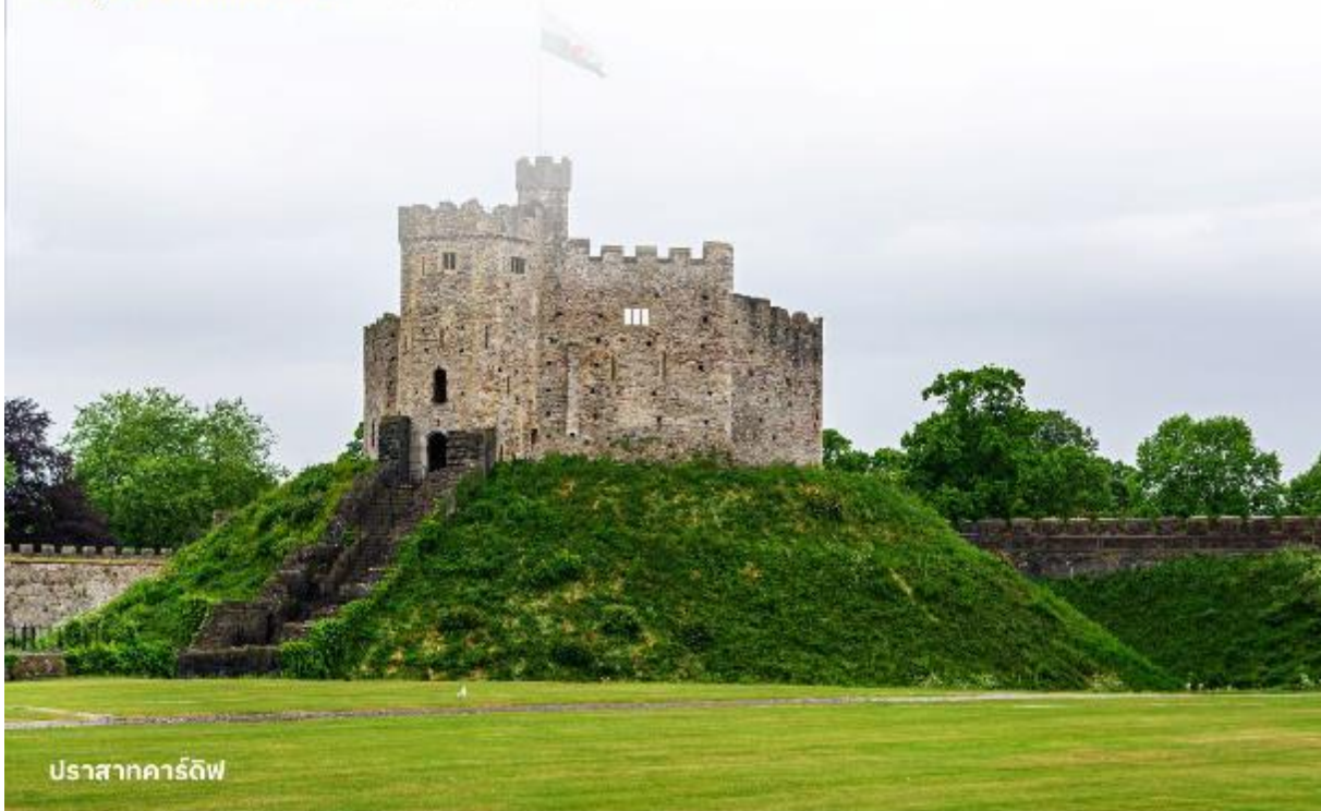
ปราสาทคาร์ดิฟฟ์

บริการอาหารค่ำ ณ ภัตตาคาร นำท่านเข้าสู่ที่พัก Clayton Hotel Cardiff หรือเทียบเท่า