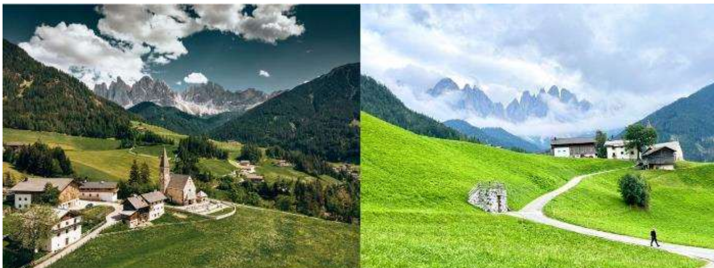
Santa Maddalena - Val di Funes