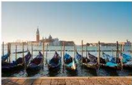
เรือกอนโดล่า

นำท่านออกเดินทางสู่ ท่าเรือตรอนเกตโต เพื่อเตรียมตัวนั่งเรือข้ามสู่เกาะเวนิส เกาะเวนิสเป็นดินแดนแสนโรแมนติก เป็นเมืองที่ไม่เหมือนใคร โดยใช้เรือแทนรถ ใช้คลองแทนถนน มีสมญานามว่าเป็น “ราชินีแห่งทะเลเอเดรียติก” มีเกาะน้อยใหญ่กว่า 118 เกาะและมีสะพานเชื่อมถึงกัน กว่า 400 แห่ง