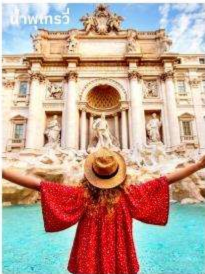
น้ำพุเทรวี่

จากนั้นอิสระตามอัธยาศัยกับการเลือกซื้อสินค้าแฟชั่นและของที่ระลึกในบริเวณย่าน บันไดสเปน (The Spanish Step) ซึ่งเป็นแหล่งแฟชั่นชั้นนำสุดหรูและยังเป็นแหล่งนัดพบของชาวอิตาเลียน