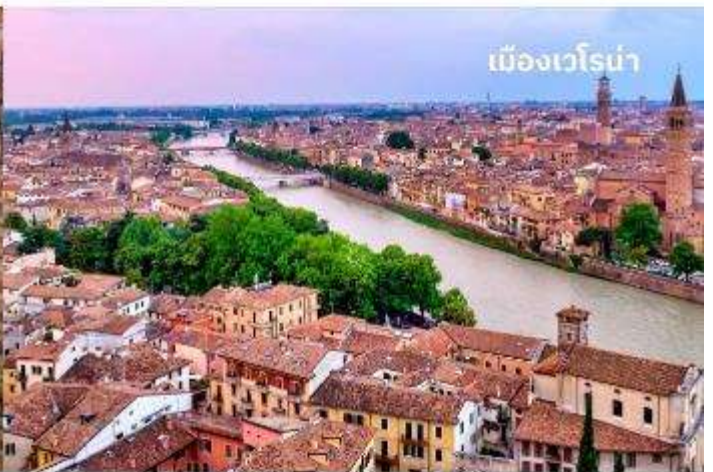
เมืองเวโรน่า