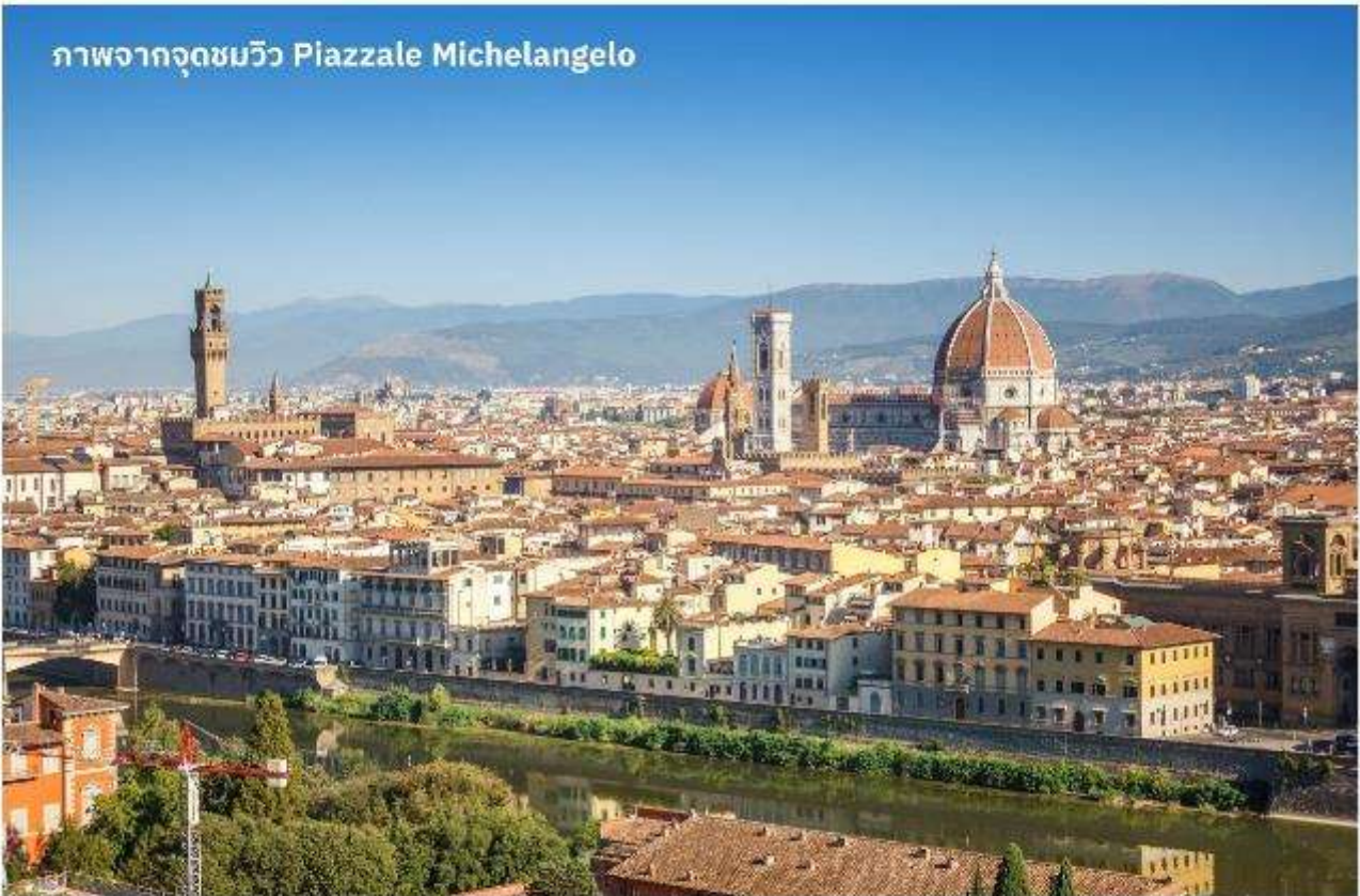
ภาพจากจุดชมวิว Piazzale Michelangelo

เมืองฟลอเรนซ์ ตั้งอยู่ทางตอนเหนือของประเทศอิตาลี เป็นเมืองที่มีชื่อเสียงในช่วงศตวรรษที่ 13-14 ซึ่งเป็นยุคที่เจริญรุ่งเรืองของวัฒนธรรมและศิลปะ อีกทั้งในอดีตยังมีความสำคัญทางการค้าและวัฒนธรรม มีสถาปัตยกรรมที่งดงามและเป็นที่มาของศิลปะ-โรมานติกที่เจริญรุ่งเรืองอย่างมากในยุคนั้น นำท่านเดินทางไปยังเนินเขา Piazzale Michelangelo เพื่อชมวิวของเมือง Florence ที่นักท่องเที่ยวรวมไปถึงชาว Florence เอง มักขึ้นมาชมบรรยากาศในมุมสูงของเมือง ซึ่งจะเห็นหลังคาสีแดงของอาคารบ้านเรือนต่างๆ รวมไปถึง Duomo เรียงรายกันเป็นแนวสวยงามยิ่งนัก อีสาระให้ท่านเก็บภาพประทับใจตามอัธยาศัย