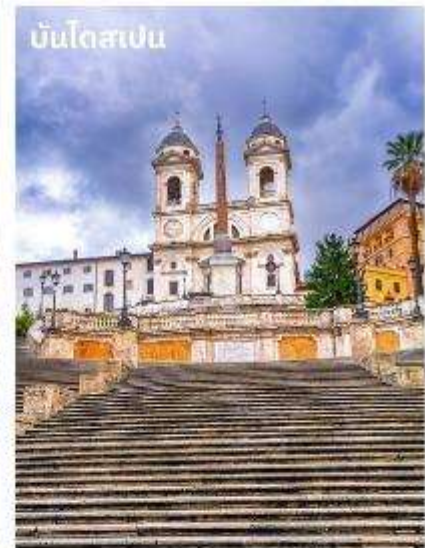
บันไดสเปน