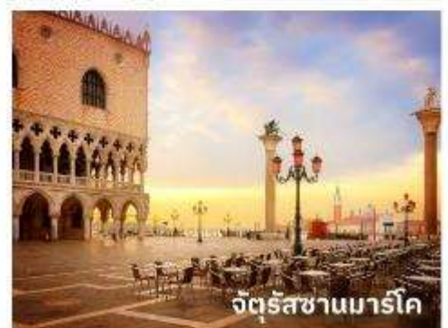
จัตุรัสซานมาร์โก

ท่านสามารถทำการสแกน QR CODE นี้ เพื่อรับชม เกาะเวนิส ในรูปแบบวีดีโอ