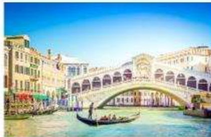
สะพานริอัลโต