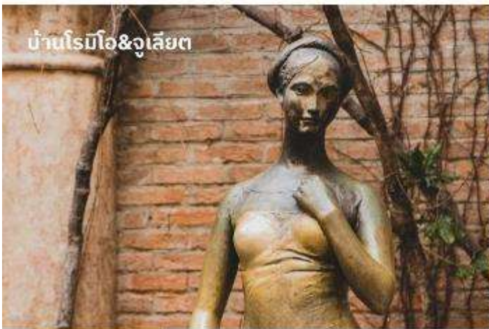
บ้านโรมิโอ&จูเลียต

ท่านสามารถทำการสแกน QR CODE นี้ เพื่อรับชม ที่เที่ยวในเมืองเวโรน่า ในรูปแบบวิดีโอ