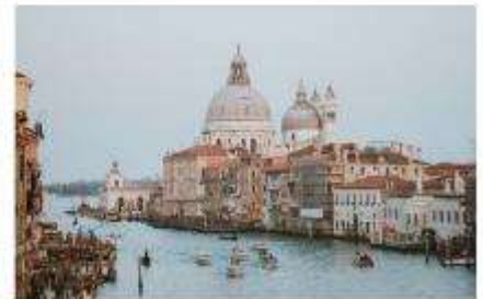
แกรนด์คาแนล

นำทุกท่านนั่งเรือต่อเพื่อไปยัง ท่าเรือซานมาร์โก (San Marco Pier) บนเกาะเวนิส แวะให้ท่านถ่ายรูปสวยๆ เก็บเป็นที่ระลึกกันที่ พระราชวังดอดจ์ พระราชวังริมน้ำแสนอลังการ ที่สร้างตั้งแต่ศตวรรษที่ 14 ในสไตล์เวเนเซียนโกธิค ที่เคยเป็นที่ประทับของผู้ปกครองของเวนิส แต่ตั้งแต่ปี 1923 ก็ได้เปลี่ยนเป็นพิพิธภัณฑ์ให้คนทั่วไปได้เข้าชม เป็นหนึ่งในแลนด์มาร์คหลักของเวนิส จากนั้นเดินเที่ยวชมแลนด์มาร์คสำคัญต่างๆ ในเมือง จัตุรัสเซนต์มาร์ค เป็นจัตุรัสหลักของเมืองเวนิส และยังเป็นศูนย์กลางเมืองตั้งแต่โบราณ จากนั้นนำท่านถ่ายรูปกับ มหาวิหารเซนต์มาร์ค มหาวิหารใหญ่ ของศาสนาคริสต์นิกายโรมันคาทอลิก อลังการด้วยการตกแต่งด้วยโดมใหญ่ และที่อยู่ติดกันและโดดเด่นด้วยความสูงถึง 50 เมตรก็คือ หอรบั้ง ถือเป็นหนึ่งในสัญลักษณ์ของเมืองที่ เห็นได้ไม่ว่าจะอยู่มุมไหนของเมืองก็ตาม และที่พลาดไม่ได้เลยก็คือ สะพานถอนหายใจ สะพานอันโด่งดังแห่งนี้ตั้งอยู่เหนือแม่น้ำที่คั่นกลางระหว่างคูเก่ากับพระราชวังดอดจ์