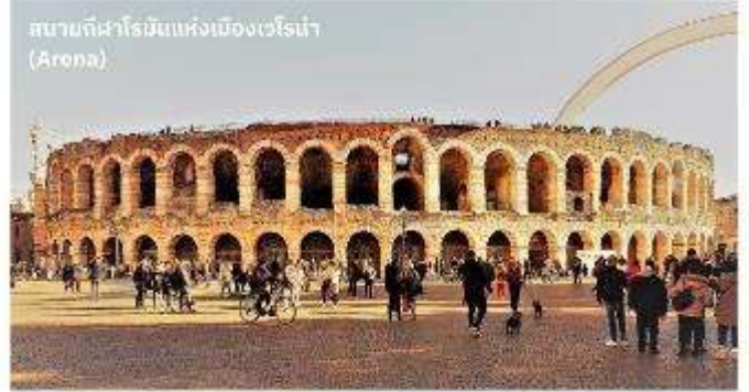
สนามกีฬาโรมันแห่งเมืองเวโรน่า (Arona)

บริการอาหารค่ำ ณ ภัตตาคาร นำท่านเข้าสู่ที่พัก Best Western Plus Hotel Expo หรือเทียบเท่า