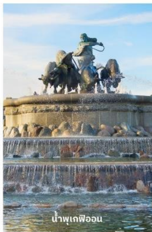
น้ำพุเกฟิออน