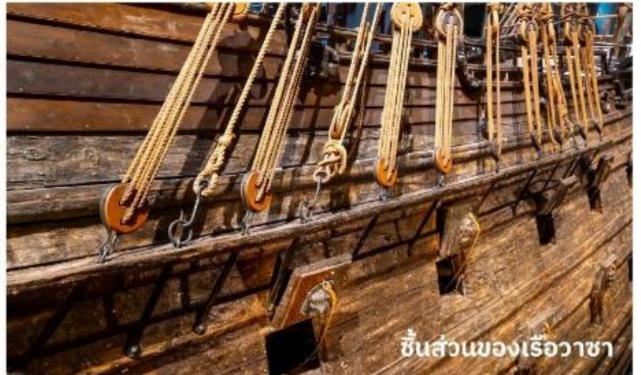
ชิ้นส่วนของเรือวาซา