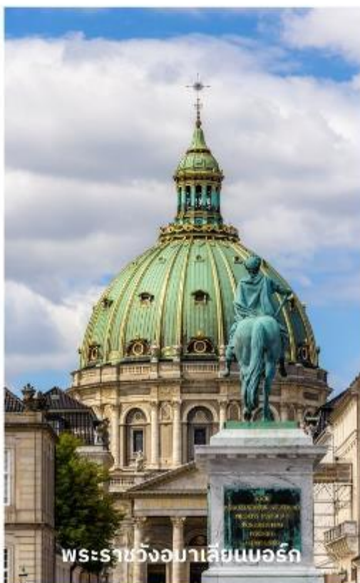
พระราชวังอมาเลียนบอร์ก