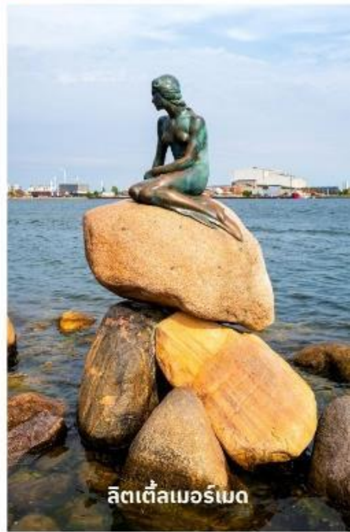
ลิตเติ้ลเมอร์เมด