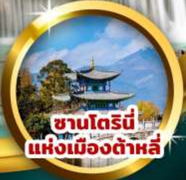
ซานโตรินี แห่งเมืองต้าหลี่