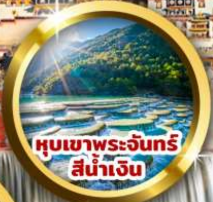
หุบเขาพระจันทร์ สีน้ำเงิน