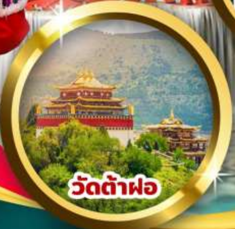
วัดต้าฝอ