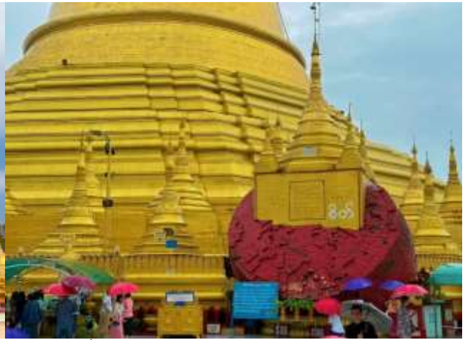
นำคณะเดินทางสู่ เมืองไจ้กัทโย (Kyaikhtyo) ใช้เวลาเดินทางประมาณ 2-3 ชั่วโมง