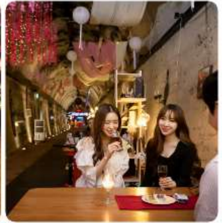
ตามใจชอบ

ถ้าไวน์แห่งกิมแฮ ราชบีเบอร์รี่พันธุ์ที่ถูกคัดสรรมาอย่างดี ผลิตผลทางการเกษตรที่ออกงามอย่างสมบูรณ์ในภูมิภาคประเทศ และภูมิอากาศของกิมแฮ วัตถุประสงค์ตั้งต้นสุดพิเศษ เพื่อนำมาผลิตเป็นไวน์ชั้นเลิศ... กับสถานที่หมักไวน์ที่ไม่เหมือนที่ใดในโลก นั่นคืออุโมงค์แซงนิม อุโมงค์รถไฟที่ถูกทิ้งร้าง ถูกบูรณะและสร้างเป็นที่บ่มและเก็บไวน์ตลอดความยาว 215 เมตรของอุโมงค์แห่งนี้ ถูกตกแต่งและจัดสรรเป็นพื้นที่แห่งความสุข โดยมีทั้งหมู่บ้านสตอรี่ของเบอร์รี่ มาสคอตของอุโมงค์แห่งนี้ ที่เป็นเหมือนสวนสนุกเล็ก ๆ และพร้อมด้วยร้านจำหน่ายไวน์ราชบีเบอร์รี่ และไวน์อีกหลากหลายชนิดมีไว้ให้ชิม และเลือกสรร