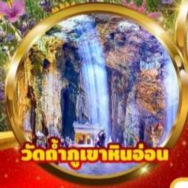
วัดถ้ำกูเขาหินอ่อน