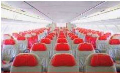
เครื่องลำใหญ่ 377 ที่นั่ง