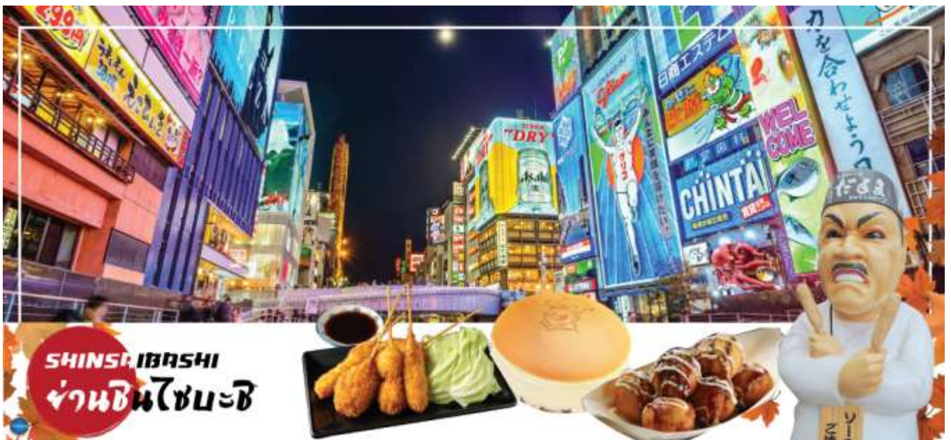
เย็น อิสระรับประทานอาหารเย็นตามอัธยาศัย

จากนั้นอิสระช้อปปิ้ง ย่านชินไซบาชิ (Shinsaibashi) (ใช้เวลาเดินทางประมาณ 1 ชั่วโมง) บริเวณแหล่งช้อปปิ้งแห่งนี้มีความยาวประมาณ 600 เมตร เต็มไปด้วยร้านค้าปลีก ร้านแฟชั่น ร้านเครื่องสำอางค์ ร้านรองเท้า กระเป๋า นาฬิกา ร้านกาแฟ ร้านอาหาร ร้านขนม ร้านเสื้อผ้าสตรีทแบรนด์ ทั้งญี่ปุ่นและต่างประเทศ เช่น Zara H&M Beans ABC Mart เป็นต้น เรียกว่ามีทุกอย่างที่ต้องการ รวมกันอยู่บริเวณนี้ ใกล้กันท่านสามารถเดินไปยัง ย่านโดทงโบริ (Dotonbori) ย่านบันเทิงยามค่ำ คินดอลอดแนวถนนเลียบบคลองโดทงโบริ จากสะพานโดทงโบริบาชิไปจนถึงสะพานนิปปอนบาชิ ไฮไลท์!!! ใครๆ ก็เซ็คอิน ถ่ายภาพคู่ ป้ายกูลิโกะแมน หรือ ป้ายโดทงโบริกูลิโกะ (Dotonbori Glico Sign) เป็นป้ายไฟนีออนรูปนักกรีฑากำลังวิ่งอยู่บนลู่วิ่ง ซึ่งถูกติดตั้งมาตั้งแต่ ปี ค.ศ.1935 นอกจากนี้ยังมีอีกหนึ่งสัญลักษณ์สถานที่นัดพบกันหลง นั่นก็คือ ร้านปูคานิโดรากุ (Kani Doraku) ซึ่งมีป๊อปปูล่าร์และลูกค้าได้อีกด้วย และห้ามพลาดสำหรับ ทาโกยากิ อาหารท้องถิ่นของชาวโอซาก้า ที่มาถึงถิ่นแล้วต้องลอง Original Taste รับประทานไม่ผิดหวังแน่นอน