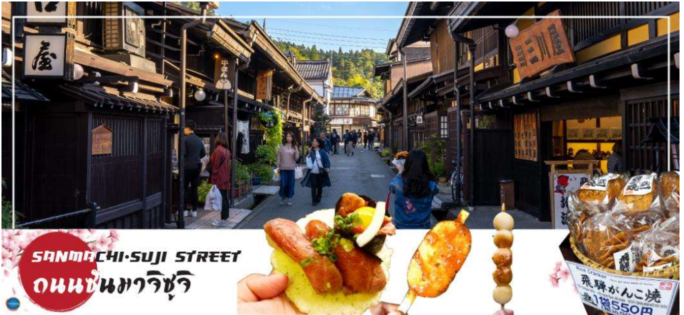
เดินทางกลับเมืองนาโกย่า (ใช้เวลาเดินทางประมาณ 2.30 ชั่วโมง)

อิสระให้ท่านเดินเล่น ถนนซันมาจิซุจิ (Sanmachi-Suji Street) ซึ่งถูกขนานนามว่าเป็น ลิตเติลเกียวโต หรือ เกียวโตน้อย เป็นย่านเมืองเก่าแก่ที่ยังคงอนุรักษ์ไว้ซึ่งอารยธรรมขนบธรรมเนียมประเพณีในอดีตของชาวญี่ปุ่นได้อย่างสมบูรณ์ บ้านเรือน, ร้านค้า, คาเฟ่และโรงสากะ สร้างขึ้นด้วยไม้แบบโบราณ และยังคงบรรยากาศแบบสมัยเอโดะไว้ นอกจากนี้ยังมี วัด, ศาลเจ้า, สะพานและตลาดเช้าที่คึกคักเต็มไปด้วยผู้คน ตัวเมืองสวยสะอาด ทันสมัย และมีสภาพธรรมชาติอันอุดมสมบูรณ์