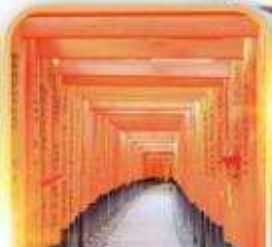
ฟูชิมิ อินาริ