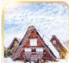
หมู่บ้านอิระคาว่าโกะ

โอซาก้า นาโกย่า เกียวโต ฮิระฮอบบิง 1 วันเต็ม