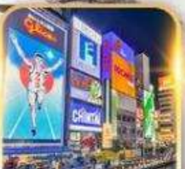
ชินไซบาชิ