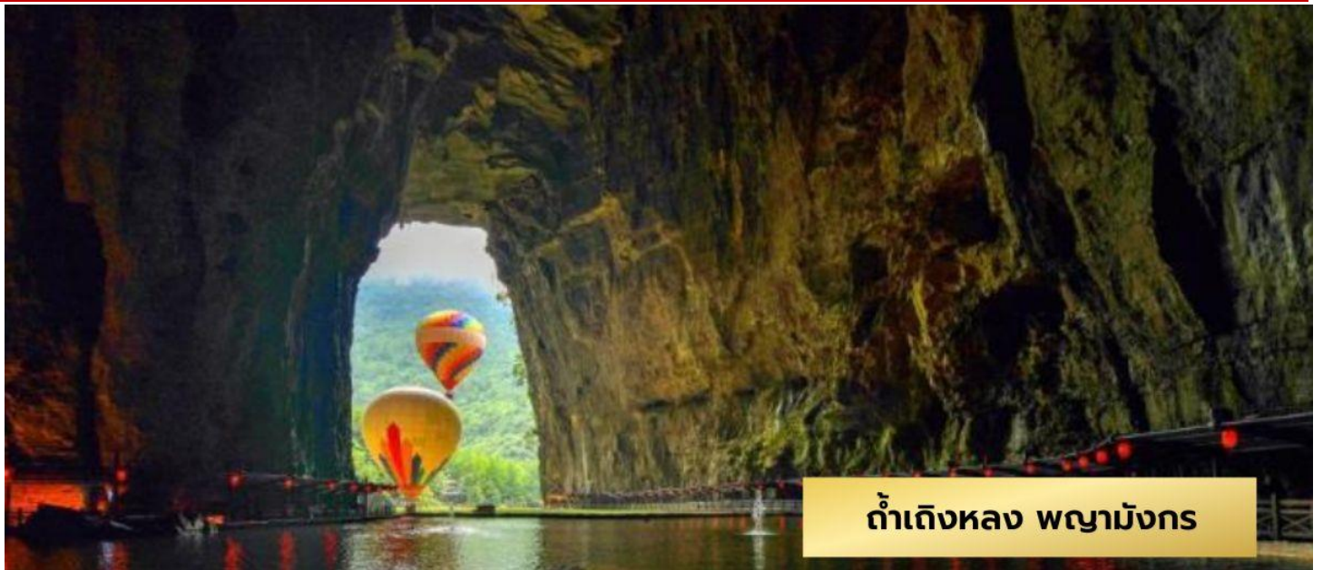
ถ้ำแดงหลวง พญามังกร