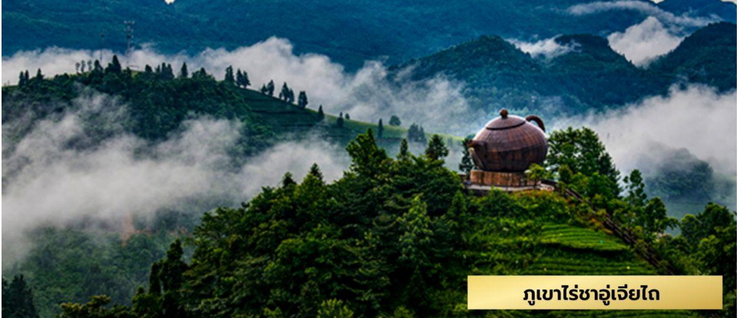
ภูเขาไร่ชาอู่เจียไถ