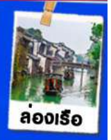
ล่องเรือ