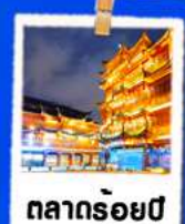
ตลาดร้อยปี