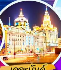
เดอะบันด์