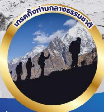
เทรคกิ้งท่ามกลางธรรมชาติ