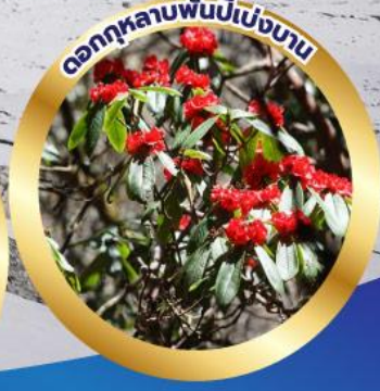
ดอกกุหลาบพันปีเบ่งบาน