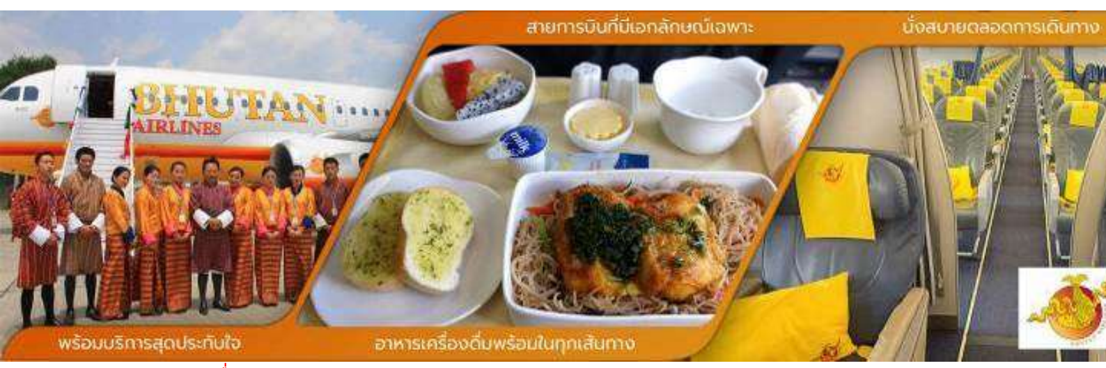
พร้อมบริการสุดประทับใจ